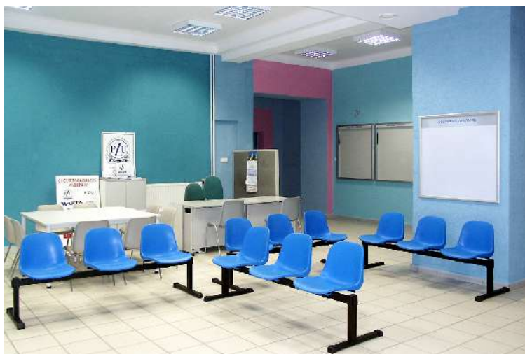
Biuro Obsługi Interesanta w budynku Urzędu Miasta

Wprowadzono zmianę organizacyjną wydzielając z Wydziału Geodezji i Gospodarki Nieruchomościami Wydział Mienia i Nadzoru Właścicielskiego. To rozwiązanie już przyniosło korzyści w postaci zwiększenia wpływów ze sprzedaży i dzierżawy nieruchomości komunalnych.