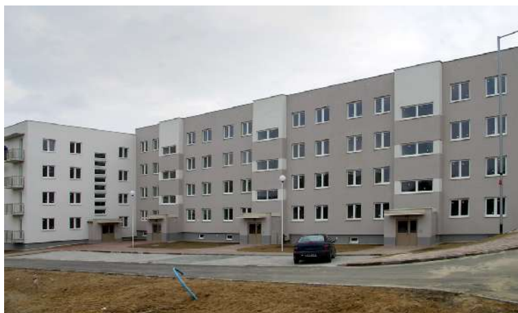
Osiedle TBS w dzielnicy Północ