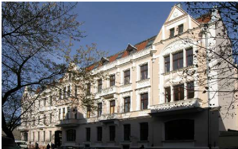
Odrestaurowana kamienica przy ul. Katedralnej 8