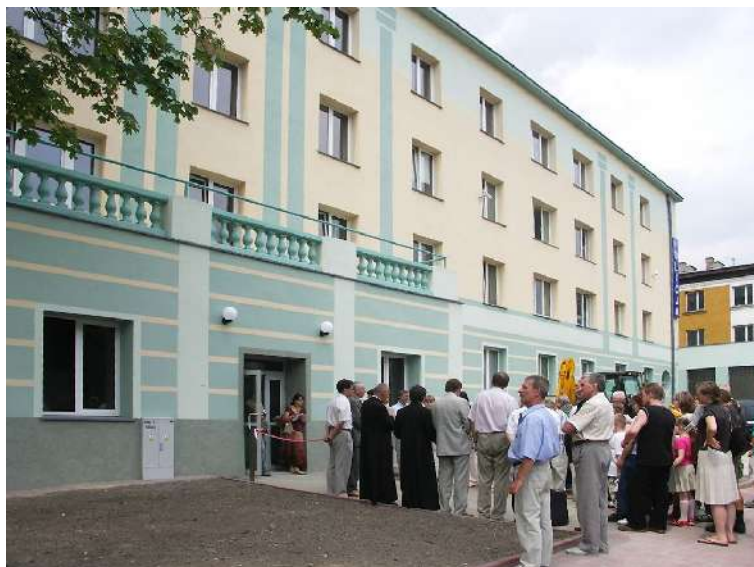
Blok mieszkalny przy ul. Łukasińskiego