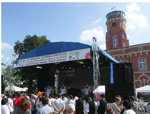
Europejskie Dni Kultury Ludowej

Miasto wykupiło także od właściciela prywatnego teren, na którym znajduje się stadion „Włodara” na Stradomiu. Klub dzięki temu może inwestować w rozwój. Rozpoczęto modernizację stadionu piłkarskiego „Raków”, przystosowując go do wymogów II ligi. Ponad 20 tys. młodych ludzi mogło aktywnie spędzać czas wakacji letnich i zimowych dzięki dotowanym z budżetu miasta ofertom aktywnego wypoczynku. Na zasadzie partnerstwa z organizacjami pozarządowymi zorganizowano Dzień bez Samochodu. Specyficzną formą partnerstwa był współdziałanie młodych ludzi w projektowaniu inwestycji rekreacyjnych. W ten sposób zaplanowano i wykonano skate-park na Promenadzie Czesława Niemena. Podobna forma towarzyszyła planowaniu rozbudowy ścieżek rowerowych. Dla dobra młodzieży zorganizowano zimą sztuczne lodowisko na płycie rynku Starego Miasta. Realizowana jest także modernizacja lodowiska i budowa kortów przy ul. Sobieskiego. Powstały deptaki spacerowe nad Wartą. W sezonie letnim organizowane są regularne spływy kajakowe tą rzeką do Mstowa. W sierpniu Częstochowa gościła uczestników Międzynarodowego Spływu Kajakowego Wartą do Poznania. Wydany został przewodnik po rzece opisujący walory Przełomu Mirowskiego.