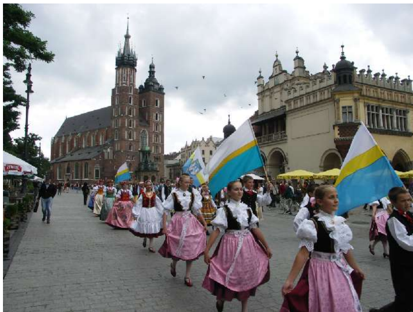
650-lecie lokacji Częstochowy – prezentacja na Rynku Krakowskim

Częstochowa kontynuowała pomoc dla Polonii w Europie Wschodniej. Symbolicznym akcentem tych związków było przekazanie przez Prezydenta Miasta narodowych strojów ludowych dla zespołu pieśni i tańca „Wileńszczyzna” obchodzącego swoje 25-lecie.