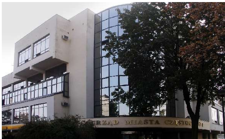
Nowy budynek Urzędu Miasta Częstochowy