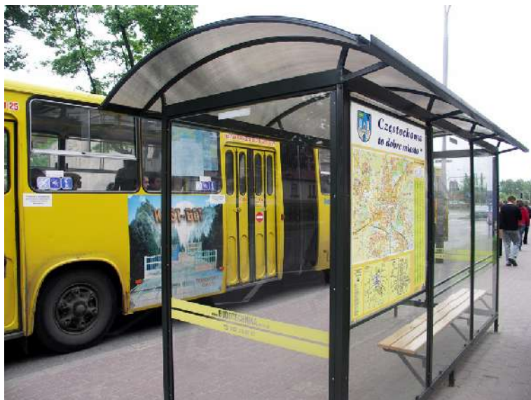
Nowe wiaty z planami miasta na przystankach MPK