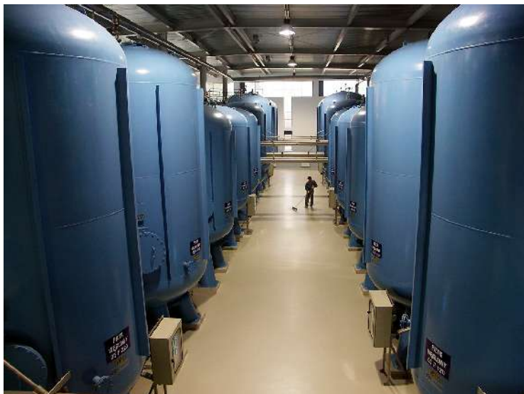
Stacja uzdatniania wody