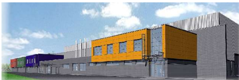
Park Przemysłowy – budowana hala przy ul. Legionów