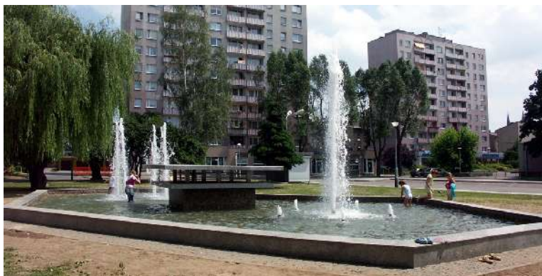
Fontanna przy Filharmonii