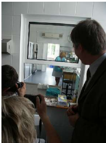
Szpital Miejski – wyposażenie ratujące życie