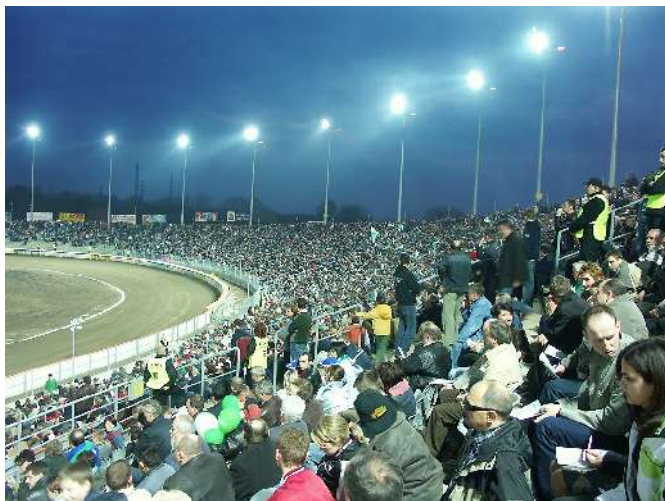
Stadion Miejski przy ul. Olsztyńskiej po przebudowie

Duże znaczenie dla sportu częstochowskiego miała ukończona w wymaganym terminie, przed 1 kwietnia 2006 r., modernizacja Stadionu Miejskiego przy ul. Olsztyńskiej. Dzięki zamontowanemu oświetleniu spełnione zostały wymagania i drużyna „Włókniarza - Złomrexu” mogła w swoim mieście walczyć o tytuł wicemistrzowski. Zmodernizowany stadion pozwala na ubieganie się o organizację imprez najwyższej, międzynarodowej rangi. Obecnie trwają starania o organizację w Częstochowie zawodów z cyklu Grand Prix.