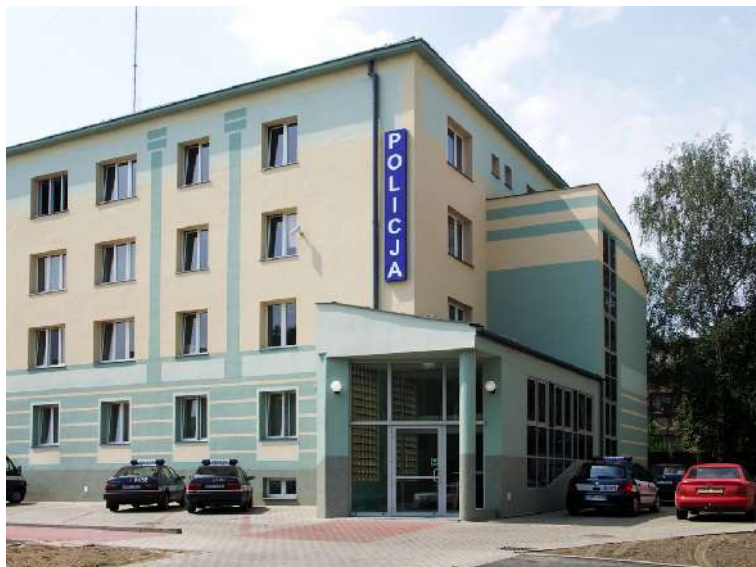
Komisariat Policji przy ul. Łukasieńskiego