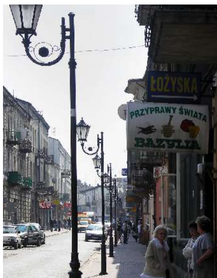
ul. Berka Joselewicza