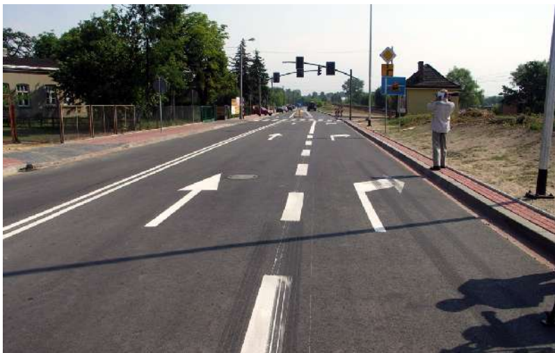
Ulica Wały Dwernickiego po modernizacji