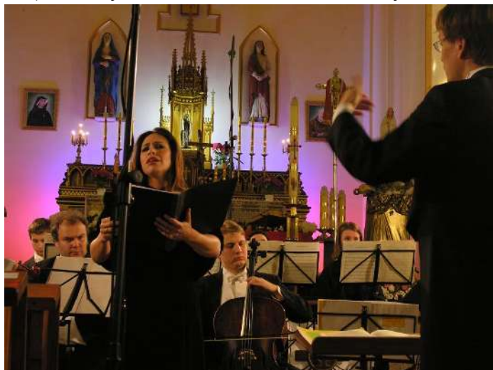
Koncert w ramach Festiwalu „Gaude Mater”

Miasto współuczestniczyło także w rocznicowych uroczystościach kościelnych: 350. rocznicy Ślubów Jana Kazimierza, 50. rocznicy Odnowienia Ślubów przez Prymasa Polski Kardynała Stefana Wyszyńskiego, 40. rocznicy Millenium Chrztu Polski i 15. rocznicy VI Światowego Dnia Młodzieży. Uczczono je m.in. prawykonaniem oratorium „Ślubu Jana Kazimierza” w trakcie Międzynarodowego Festiwalu Muzyki Sakralnej „Gaude Mater”, wystawą poświęconą prześladowaniu Kościoła w okresie Millenium Chrztu Polski (przygotowaną wraz z prelekcją multimedialną przez IPN) oraz wydawnictwami okolicznościowymi.