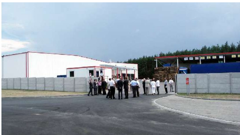
Rozpoczęcie budowy nowej inwestycji TRW

W 2006 r. w ewidencji podatkowej odnotowano 17 nowych firm, znaczących płatników podatku od nieruchomości. Na obszarze zwolnionym przez Hutę „Częstochowa” powstał zakład - cynkownia Polimex-Mostostal Siedlce. Bardzo ważnym wydarzeniem stało się rozpoczęcie w październiku 2006 r. budowy Centrum Badawczo - Rozwojowego TRW oraz rozbudowa zakładu produkującego poduszki powietrzne; docelowo stworzy to 1100 nowych miejsc pracy.