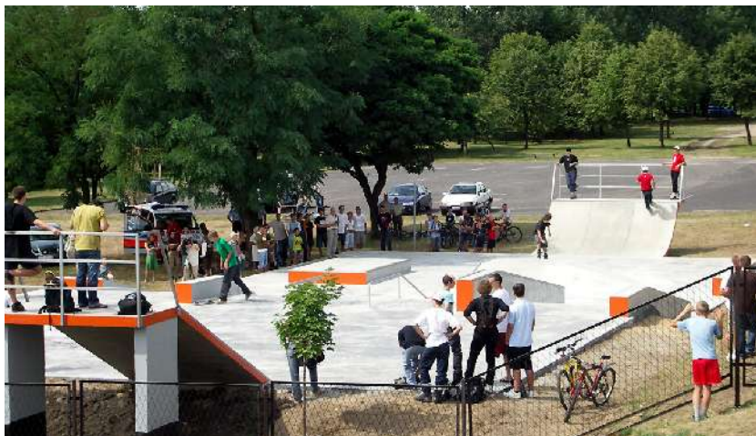
Skate-park na Promenadzie Czesława Niemena