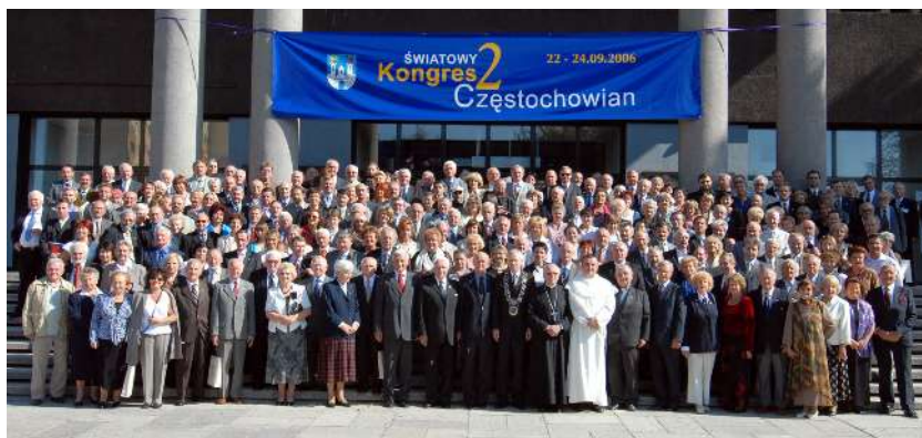
Zbiorowa fotografia uczestników II Kongresu Częstochowian