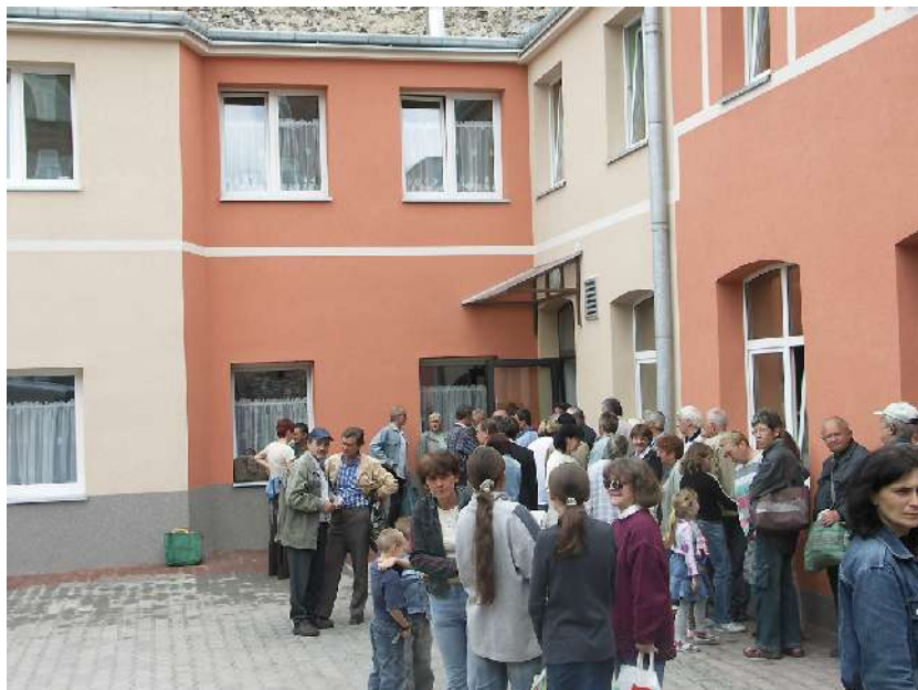
Stołówka i hostel dla biednych na ul. Krakowskiej

Po zmianach ustawowych MOPS przejął obowiązek wypłacania zasiłków rodzinnych. Związana z tym, liczba świadczeniobiorców obsługiwanych przez referat zasiłków rodzinnych przekracza 22 tysiące osób.