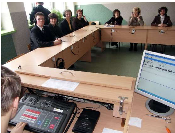
Pracownia języków obcych w „Norwidzie”