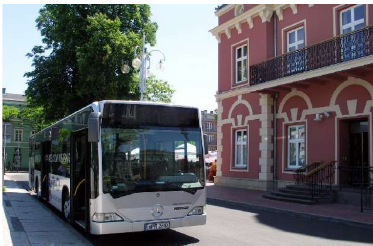
Nowe mercedesy dla MPK