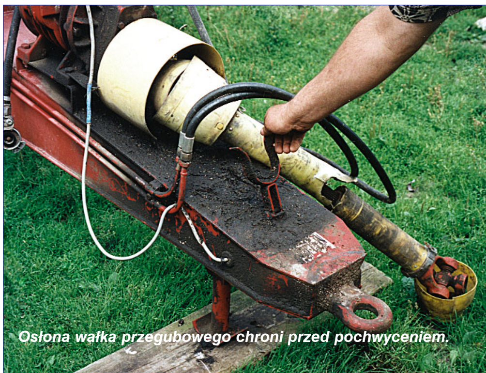
Ostłona wałka przegubowego chroni przed pochwytnieniem.

Jeśli zaobserwujesz nieprawidłowości, nie wahaj się zwrócić uwagę doro-