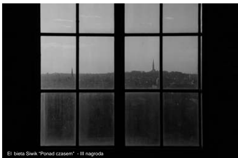
Elbieta Siwik "Ponad czasem" - III nagroda