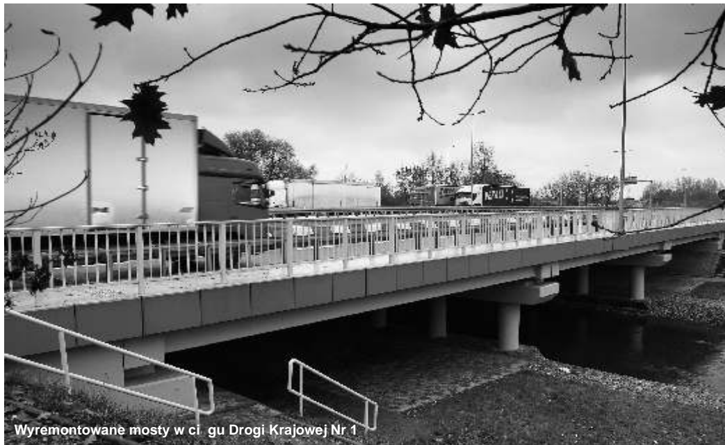
Wyremontowane mosty w ciągu Drogi Krajowej Nr 1

Blisko 50 mln zł kosztowały zmodernizowane mosty przy skrzyżowaniu DK-1 i Alei Jana Pawła II, przebudowana ul. Kordeckiego oraz układ drogowy wokół Galerii Jurajskiej z wyremontowaną ul. Stracką. Wskazane inwestycje pochodzą z funduszy zewnętrznych – pozyskanych przez Miejski Zarząd Drog lub na podstawie umowy z inwestorem budującym galerię Jurajską.