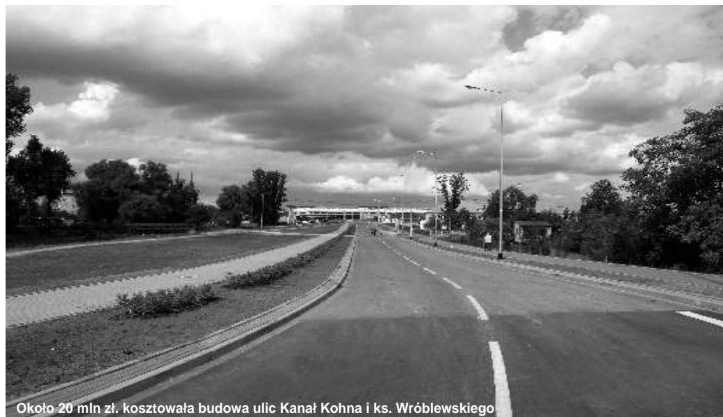
Okolo 20 mln zł. kosztowała budowa ulic Kanał Kohna i ks. Wróblewskiego

Koszt całkowity inwestycji – 8 mln 450 tys. zł. Na przebudowę ulicy Kordeckiego przyznano Człuchowie 3,5 mln zł dofinansowania w ramach Poddziałania 7.1.2. Modernizacja i rozbudowa infrastruktury uzupełniającej kluczowe drogi województwa łódzkiego na lata 2007-2013.