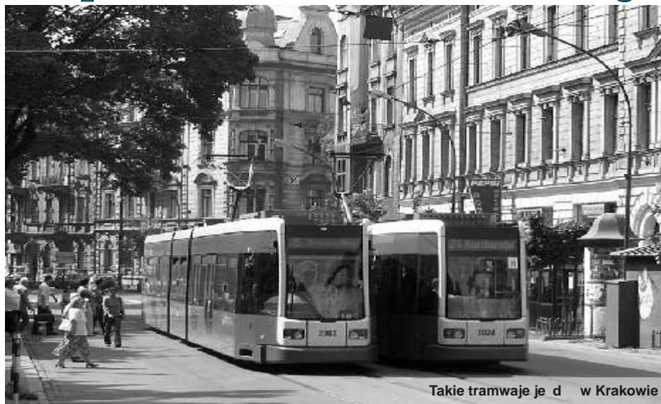
Takie tramwaje jeżdżą w Krakowie

Dwa wnioski - na budowę linii tramwajowej i zakup nowych tramwajów znalazły się na czele listy rankingowej projektów na dofinansowanie z funduszy unijnych. Rozstrzygnięciem konkursu Zarząd Województwa Śląskiego przeznaczył na nie blisko 128 mln zł.