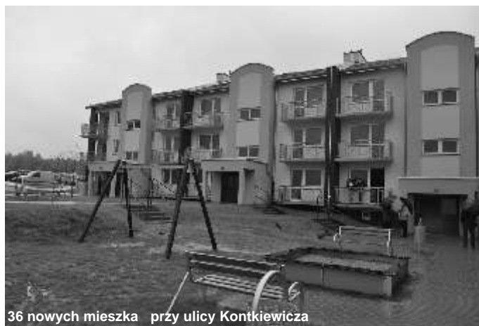
36 nowych mieszkań przy ulicy Kontkiewicza

Pierwsi lokatorzy nowego budynku komunalnego przy ul. Kontkiewicza 8 na Wyczerpach odebrali klucze do mieszkań. Blok został sfinansowany z budżetu miasta. Inwestycja kosztowała 6 mln 724 tys. zł. Zakonczono tak IV etap budowy osiedla TBS na Północy, oddając do użytku kolejny blok przy ul. Herberta, zrealizowany ze środków ZGM „TBS”, budżetu Gminy i środków Krajowego Funduszu Mieszkaniowego.