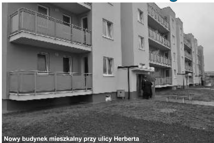
Nowy budynek mieszkalny przy ulicy Herberta