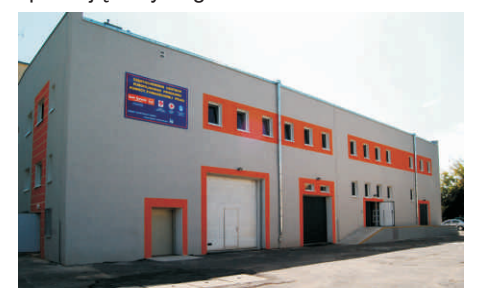
Magazyny przy ulicy Białskiej 20.

Realizują go Bank Żywności w Częstochowie, a także Polski Czerwony Krzyż, PKPS oraz Caritas. Udział w programie wymaga posiadania zaplecza magazynowego spełniającego określone warunki sanitarne. Przekazanie wyremontowanego i zaadoptowanego obiektu na koszt budżetu miasta powoduje, że częstochowskie organizacje spełniają te wymagania.