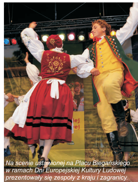
Na scenie ustawionej na Placu Biegańskiego w ramach Dni Europejskiej Kultury Ludowej prezentowały się zespoły z kraju i zagranicy.