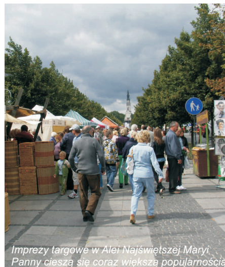
Imprezy targowe w Alei Najświętszej Maryi Panny cieszą się coraz większą popularnością

Organizatorem Wystawy był Regionalny Ośrodek Doradztwa Rolniczego w Częstochowie; współorganizatorem - Urząd Miasta Częstochowy.