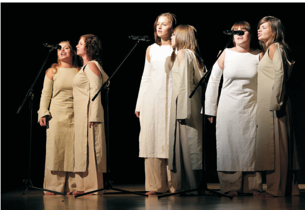
Kalokagathos - jeden z zespołów MDK.

W ciągu roku szkolnego udział w zajęciach bierze kilkadziesiąt tysięcy osób.