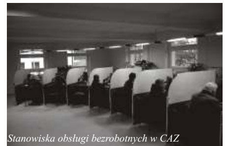
Stanowiska obsługi bezrobotnych w CAZ

W CAZ znajduje się również Klub Pracy oraz dział szkoleń. Sukcesywnie wprowadzane będą kolejne zmiany. Centrum Aktywizacji Zawodowej odpowiada za kompleksową obsługę osób bezrobotnych, poszukujących pracy i pracodawców w zakresie pośrednictwa pracy, szkoleń i doradztwa zawodowego. CAZ-y w sposób wyraźny są więc oddzielone od formy pasywnej działalności urzędów pracy - rejestracji osób bezrobotnych.