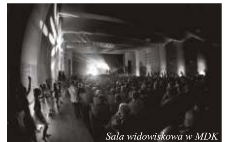
Sala widowiskowa w MDK

Młodzieżowy Dom Kultury skończył 60 lat. Już od ponad sześciu dziesięcioleci MDK zaprasza dzieci i młodzież do uczestnictwa w zajęciach, koncertach, festiwalach, przeglądach i innych imprezach w Polsce i poza jej granicami. Twórcza praca instruktorów sprawia, że dzieci i młodzież realizują swoje pasje i od lat święcą triumfy w licznych konkursach krajowych i międzynarodowych.