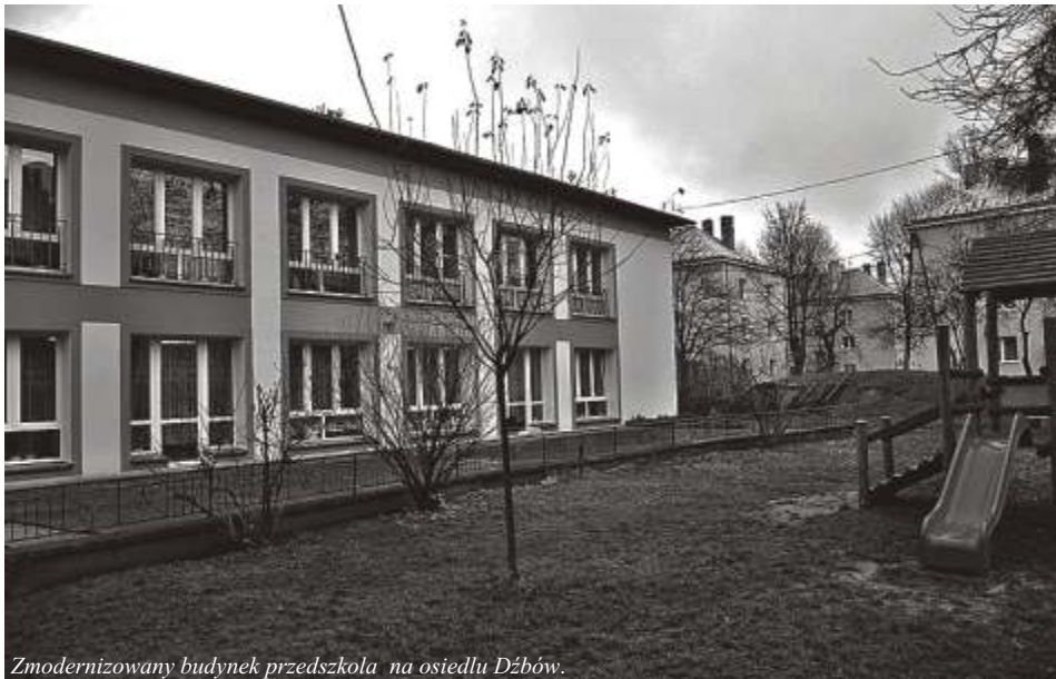
Zmodernizowany budynek przedszkola na osiedlu Dźbów.

Dzięki realizacji Programu w 610 mieszkaniach zamontowano pełnostandardowe, nowoczesne instalacje wykorzystujące gaz w 40 gruntownie odnowionych budynkach. Odpowiadają one teraz w pełni wymogom w zakresie ochrony środowiska i ekonomicznego gospodarowania energią.