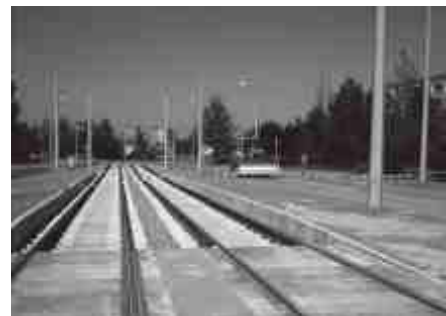
Torowisko w ulicy Orkana

Samochód, będący szczytowym osiągnięciem motoryzacji w zakresie ekologicznego transportu elektrycznego, użytkuje częstochowska Straż Miejska. Auto służy przede wszystkim zapewnianiu bezpieczeństwa w czasie dużych zgromadzeń, pielgrzymek i masowych imprez, co w pełni pozwala na wykorzystanie jego zalet, a w szczególności walorów ekologicznych.