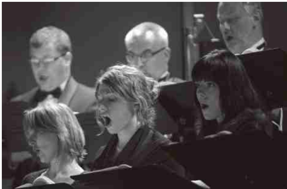
Polski Chór Kameralny - Schola Cantorum Gedanensis.

Wśród wykonawców tegoroczego festiwalu znaleźli się m.in. Black Voices z Wielkiej Brytanii, Polski Chór Kameralny Schola Cantorum Gedanensis, Rustavi, Zespół "La Fenice".