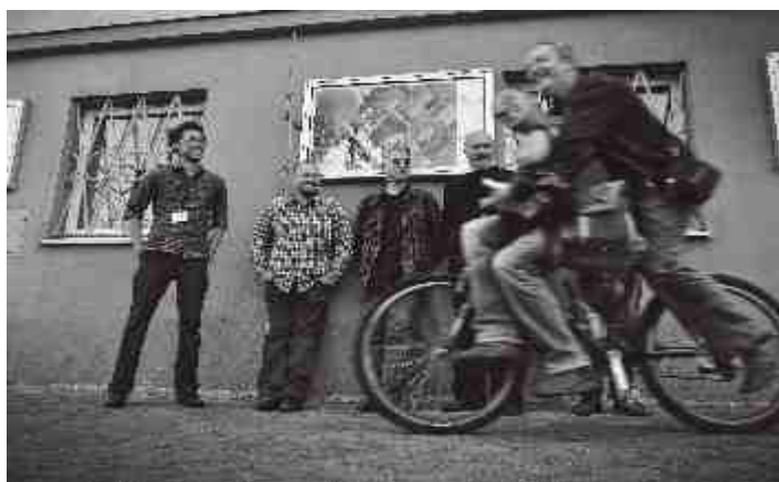
Artyści podczas otwarcia wystawy fotograficznej „Znani. Jasne, że Częstochowa”.