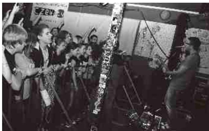
Koncert zespołu Happysad w Klubie Rura w ramach akcji „Miasto Studentów, Jasne, że Częstochowa”.

Ideą akcji jest zaangażowanie studentów w życie miasta. Kolejne weekendy października zostały wypełnione koncertami, imprezami klubowymi, wieczorami karaoke, spektaklami i wystawami.