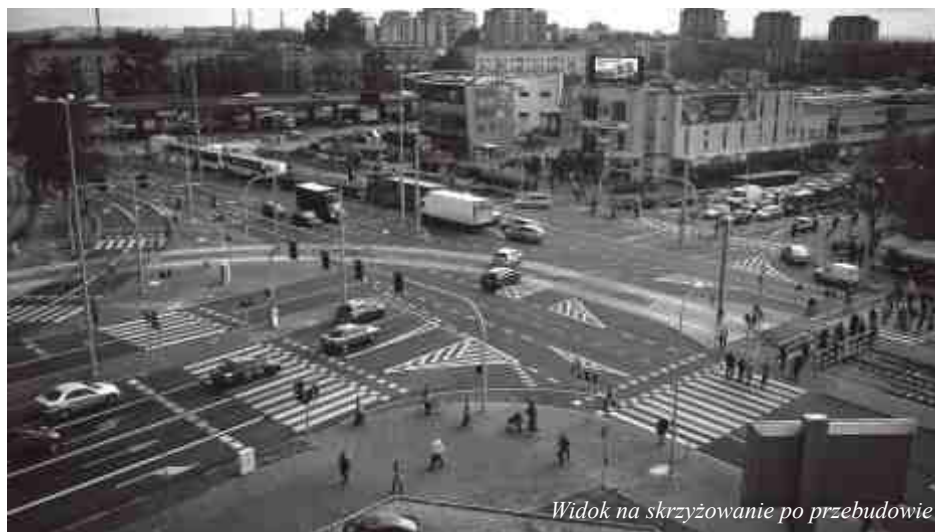
Widok na skrzyżowanie po przebudowie

Bilet zachowuje ważność na całej trasie.