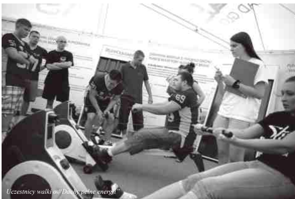
Uczestnicy walki o "Dachy pełne energii"