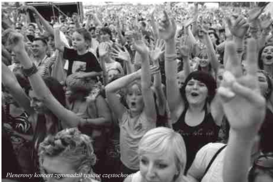
Plenerowy koncert zgromadził tysiące częstochowian