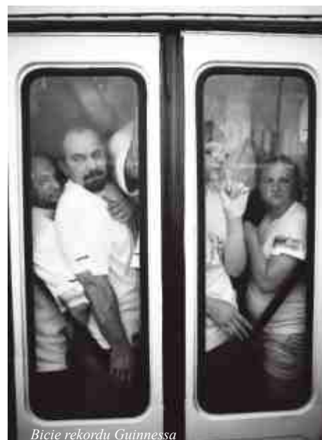
Bicie rekordu Guinnessa