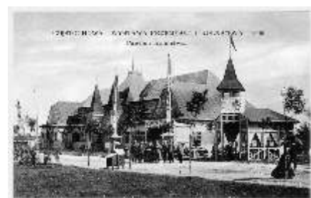
Wystawa Przemysłu i Rolnictwa na starej pocztówce