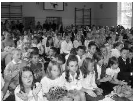
Początek roku w Szkole Podstawowej nr 26

Prezydent Tadeusz Wrona wziął udział w uroczystym rozpoczęciu roku szkolnego 2007/8 w Szkole Podstawowej nr 26. W placówce tej, podczas wakacji, dokonano termomodernizacji – ocieplono ściany zewnętrzne budynku, strop; wymieniono 156 okien. Prace te pozwoliły na wykonanie nowej elewacji. W budynku