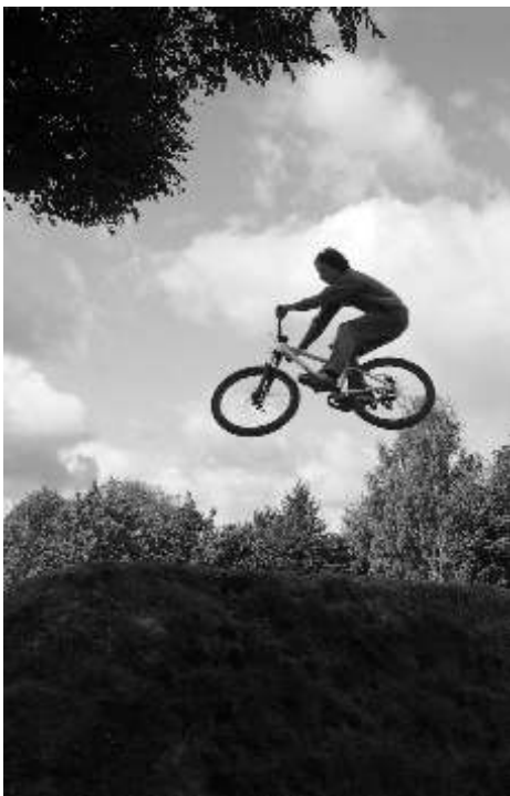
Pokaz częstochowskich rowerzystów na nowym torze doskonale wpisał się w obchody Europejskiego Tygodnia Zrównoważonego Transportu.