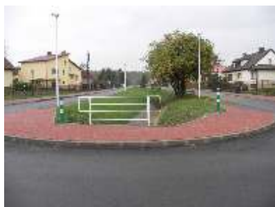
Nowowbudowana ulica Pascala

Na budow nowych dróg powstałych w ostatnich miesi cach Miasto wydało 5,5 mln zł. Trwa remont i przebudowa ulicy 7 Kamieniec (za 3,5 mln zł), przebudowa ul. Kordeckiego (za 8 mln zł). Uko czono budowy lokalnych dróg - ul. Zamoyskiego na Stradomiu (ponad 1,2 mln), ul. Mendelejewa (ponad 460 tysi cy) oraz ul. Pascala i ul. Łukasiewicza.