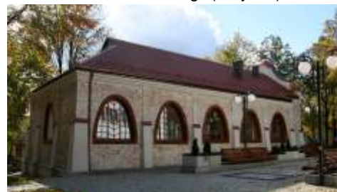
Wystawy odb d si min. w Parkach Podjasnogórskich

Wystawy odb d si w miejscach historycznie zwi zanych z tamtym wydarzeniem – w Podjasnogórskich Parkach, Alei Naj wi tszej Marii Panny oraz w budynku Muzeum Cz stochockiego. W ramach projektu zostan wykonane albumy, reprint przewodnika, reprinty pocztówek oraz film dokumentalny. Projekt b dzie realizowany przez Muzeum Cz stochockie w partnerstwie z Agencj Rozwoju Regionalnego