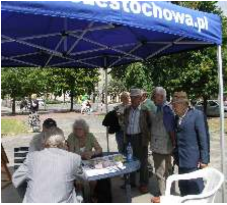
Mieszkańcy wypełniali ankiety w 6 punktach miasta, m.in. na Placu Orli i Lwowskich na Rakowie.

6 listopada radni uchwaliли kolejną wersję Miejskiego Programu Rewitalizacji. Uwzględniono w nim m.in. wyniki ankiet, które wypełniali mieszkańcy podczas przeprowadzonych w sierpniu konsultacji społecznych. Ankiety dotyczyły tego, co chcieliby, by zmieniło się w ich najbliższym otoczeniu. Te konsultacje pozwoliły zebrać opinie i informacje od mieszkańców o działnicach wyznaczonych w MPR, tak aby zapisy programu odpowiadały ich potrzebom. Dzielnice objęte programem rewitalizacji to: Ródmięcie (okolice stawów Bałtyk