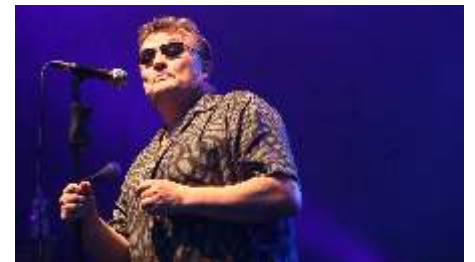
Krzysztof Cugowski z Budką Suflera gwiazdą sobotniego wieczoru.