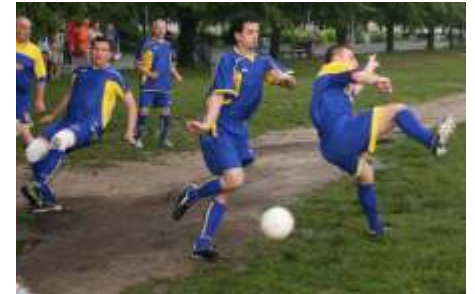
Mecz między radnymi a pracownikami samorządowymi.

Tysiące częstochowian bawiło się podczas imprez, koncertów, zawodów sportowych, konkursów zorganizowanych w ramach Dni Samorządu Terytorialnego 25-28 maja. Gwiazdą sobotniego wieczoru była Budka Suflera. Organizatorem Dnia Samorządu był Wydział Komunikacji Społecznej.