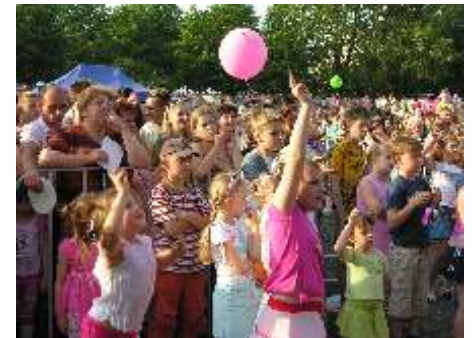
Na Promenadę Czesława Niemena przybyły tysiące mieszkańców Częstochowy.