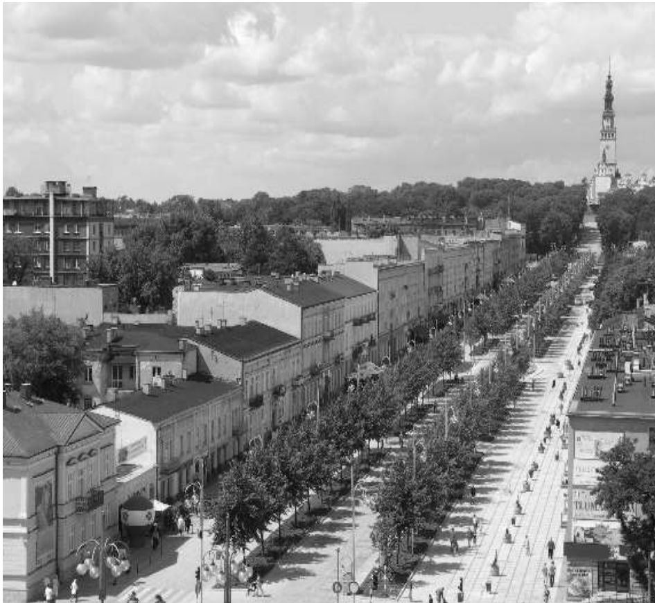
III Aleja Najświętszej Maryi Panny jest już wyremontowana, teraz czas na II