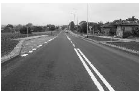
W tym roku znaczna część środków finansowych zostanie wydana na inwestycje drogowe. Na zdjęciu wybudowana w 2008 roku ul. Radomska