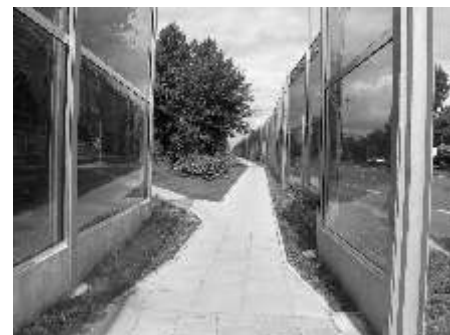
Będzie kontynuowana budowa barier dźwiękochłonnych przy DK-1

- środki budżetu miasta oraz bezzwrotne środki zewnętrzne. Środki te sfinansują zadania inwestycyjne na kwotę 89 mln zł (52,3%). W porównaniu do 2008 roku, kwotowo finansowanie włas-