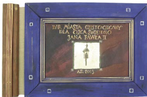
Album z reprodukcjami zdjęć Aleksandra Jaśkiewicza pochodzącymi z wystawy w Muzeum Częstochowskim „Kapliczki i krzyże przydrożne”, który Prezydent przekazał Ojcu Świętemu.