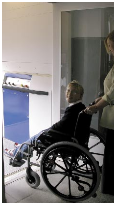
Winda w Zespole Szkół Nr 1

Ważne prace wykonano np. w Szkole Nr 49 przy ul. Jesiennej (wymiana okien za 77,5 tys. zł) oraz w Szkole Nr 24 przy ul. Hubermana (izolacja pionowa ścian i piwnic – 70 tys. zł). W Zespole Szkół nr 1 przy ul. Kukuczki zainstalowano windę (131 tys. zł), w Miejskim Przedszkolu nr 35 wymieniono źródło ciepła (135 tys. zł), trwa termomodernizacja budynku Zespołu Szkół Odzieżowych przy ul. Krakowskiej (300 tys. zł) oraz adaptacja budynku po przedszkolu przy ul. Focha na Szkołę Specjalną nr 45, która przeniesie się tam z ul. Pułaskiego. Dodatkowe 74 tys. zł, które pozyskaliśmy z Ministerstwa Edukacji i Sportu, przeznaczone będą na wymianę stolarki w LO im. J. Słowackiego. Wdrożono też dwa projekty, które przyniosą oszczędności i poprawę standardów działania źródeł ciepła w szkołach. I tak 400 tys. zł uda się zaoszczędzić na rachunkach za prąd dzięki temu, że zmieniono taryfy i ograniczono moc zamówioną. Drugi projekt wdrażany w szkołach opiewa na 8,4 mln. zł. Tyle na modernizację źródeł ciepła wyda prywatna firma, która będzie partycypowała w oszczędnościach z tytułu zastosowania nowoczesnych technologii. Prace zakończą się na początku przyszłego roku kalendarzowego. Firma zmodernizuje węzły ciepłownicze w 22 obiektach (szkoły i przedszkola) oraz zrealizuje dwie nowe kotłownie.