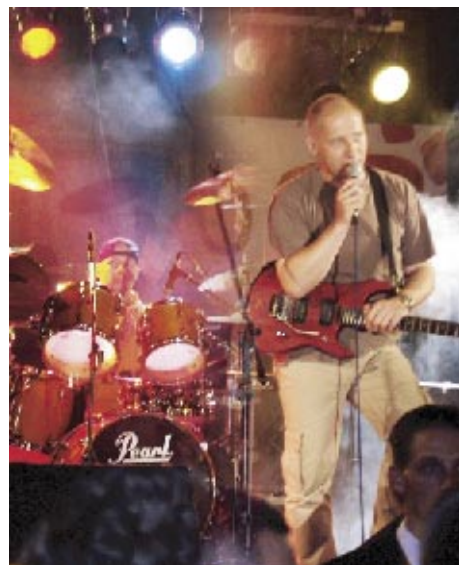
Plac Biegańskiego, 29 sierpnia Kuba Sienkiewicz i Zespół Elektryczne Gitary