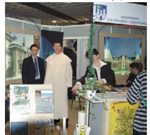
Międzynarodowe Targi Turystyczne ITB - Berlin