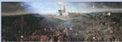
Obrona Jasnej Góry w czasie potopu szwedzkiego, obraz na łuku trybunowym Kaplicy Cudownego Obrazu.