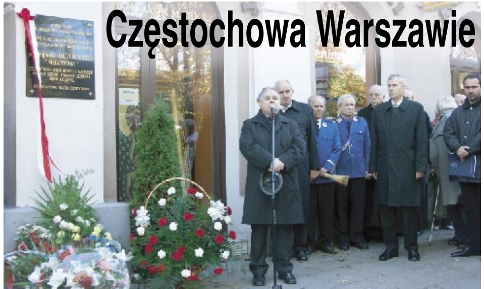
12 października 2004 r., odsłonięcie tablicy poświęconej pamięci gen. Leopolda Okulickiego przy ul. 7 Kamienic.

COESIMA łączy miasta, dla których pielgrzymowanie i turystyka są ważnymi gałęziami rozwoju. Chodzi o stworzenie sieci miast w celu zbadania zmian i nowych oczekiwań oraz prowadzenie eksperymentalnych działań stabilizujących działalność gospodarczą tak, aby podzieliły trwały rozwój miast. Odbędzie się to dzięki wymianie doświadczeń, transferowi umiejętności, wspólnej pracy realizowanej przez wyspecjalizowane biura i skierowanej na dziedziny turystyczne.