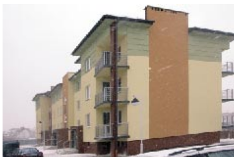
Nowy blok komunalny przy ul. Kontkiewicza 4a