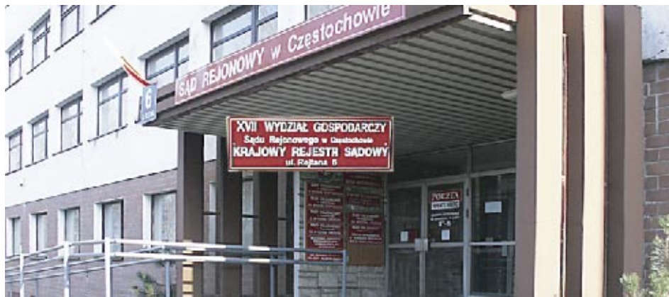
Przekazany przez Miasto budynek Sądu Rejonowego przy ul. Rejtana

Budowę rozpoczęto w sierpniu 2003 roku, a zakończono w październiku 2004. Autor projektu - architekt Aneta Chrząstek - Szczy. Wykonawca: Spółka WŁODAR. TK