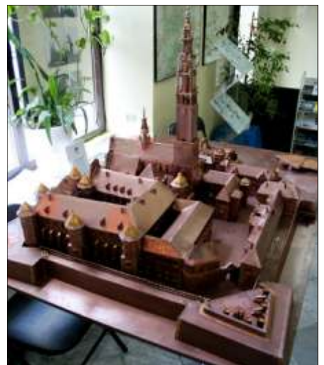
Makieta klasztoru jasnogórskiego eksponowana na targach

Targom towarzyszyły spotkania z ambasadorami, konsulami, środowiskami gospodarczymi, stowarzyszeniami polonijnymi, dziennikarzami. Efektem tego jest m.in. umieszczenie Częstochowy w ofercie biur podróży. W Berlinie, Barcelonie i Madrycie Częstochowa promowała się wspólnie z Jasną Górą. Przygotowaniem targów zajmował się Wydział Komunikacji Społecznej Urzędu Miasta. WT