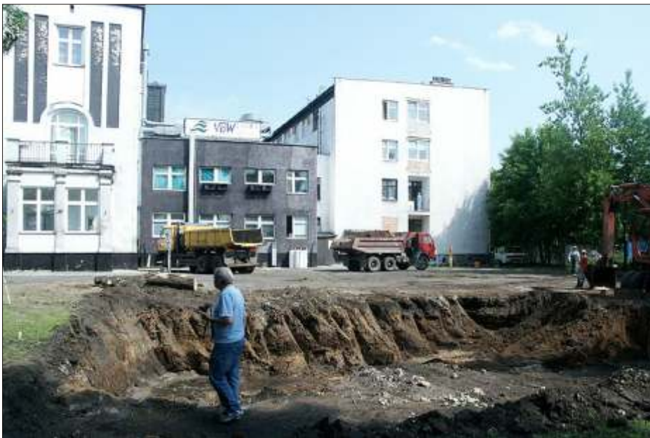
Rozpoczęta budowa bloku operacyjnego i oddziału intensywnej terapii w szpitalu przy ul. Mirowskiej