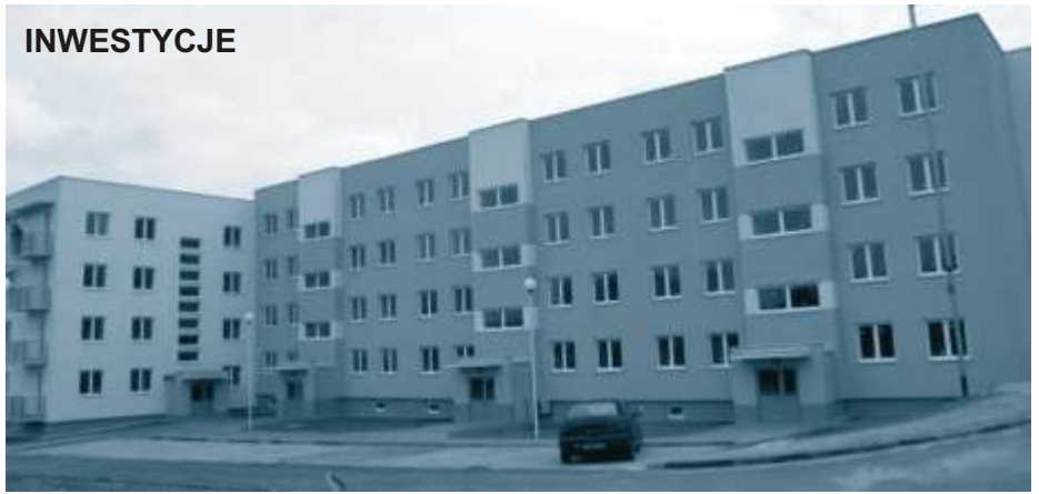
Nowy blok ZGM TBS przy ulicy Czecha 2a