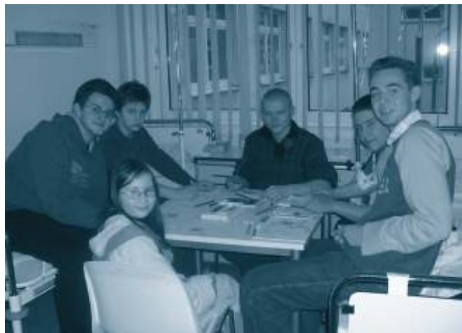
Członkowie Młodzieżowej Rady Miasta w trakcie spotkania mikołajkowego z chorymi dziećmi

przedstawia wnioski swoich wyborców, których regularnie informuje o działaniach Rady. Radny pełni obowiązki nieodpłatnie.