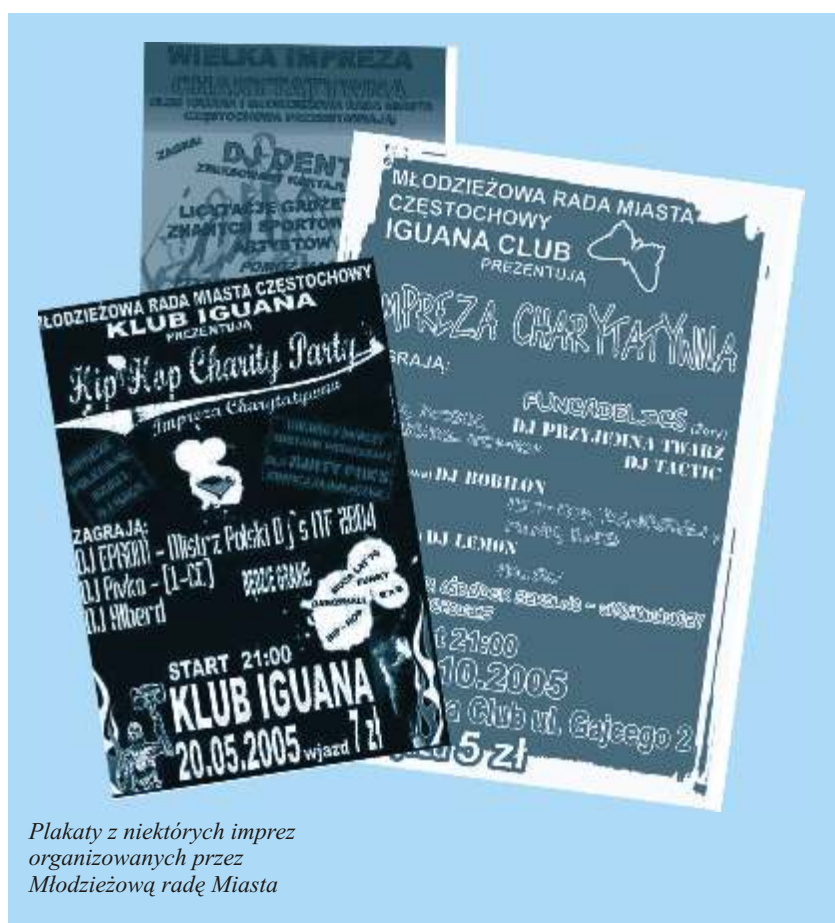
Plakaty z niektórych imprez organizowanych przez Młodzieżową radę Miasta

e-mail: br@czestochowa.um.gov.pl władze: Szef Młodzieżowej Rady Miasta Częstochowy, Zarząd Młodzieżowej Rady Miasta Częstochowy