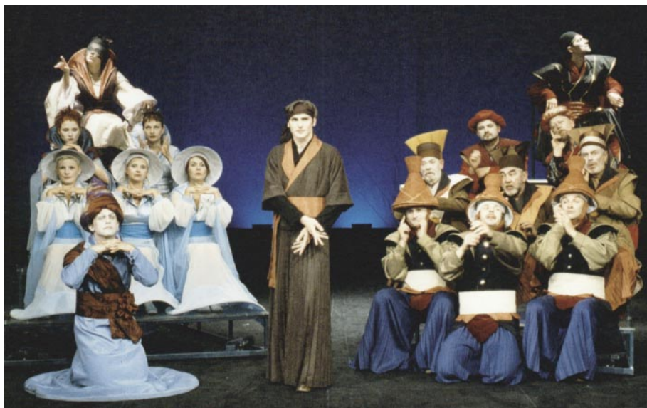
Teatr Ludowy w Nowej Hucie, "Księżniczka Turandot" według Carlo Gozziego.