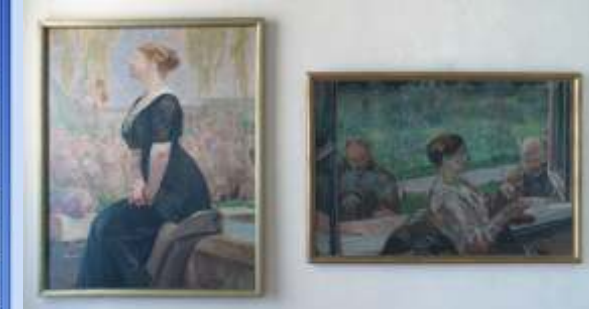
Выставка произведений Янека Мальчевского Музей Ченстоховского Архиепископства (A/B-6) ул. Св. Барбары 41, тел.+48 34 368 33 61 открыто: вторник - суббота 9.00 - 13.00 Собрания Музея представляют собой памятники старинны сакрального искусства из Ченстоховы и окрестностей, собранные в разное время, имеющие не только художественную, но также и культурную и историческую ценность. Среди скульптур следует выделить Божью Матерь с Младенцем 1430 г., фигуры Христа или образы святых, такие как: Св. Мартина из Мстова 1500 г., или Св. Иохима прекрасной резьбы середины XVIII в. Художественные композиции в большинстве своем представлены картинными святиками, близкими польской религиозной духовности, среди них: Св. Анны, Св. Антония Падевского, Св. Рохы и Св. Себастьяна, Св. Павла Отшельника, а также сцены из жизни Христа и изображения Божьей Матери. Интересной частью коллекции являются старинные монеты и медали, вручавшиеся по случаю различных костельных событий и религиозных торжеств, являющие собой своеобразную историю Костёла.

Музей Ченстоховского Архиепископства (A/B-6) ул. Св. Барбары 41, тел.+48 34 368 33 61 открыто: вторник - суббота 9.00 - 13.00