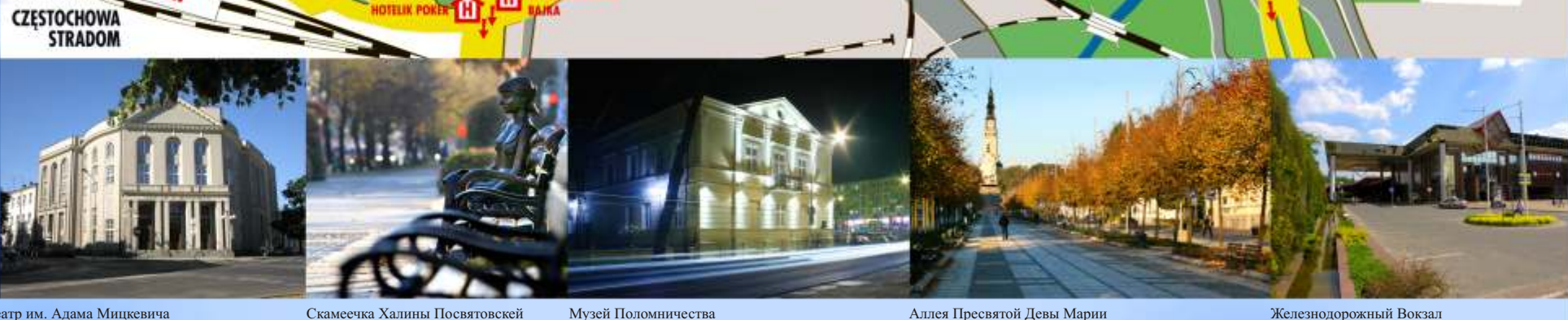
Театр им. Адама Мицкевича Скамейка Халины Посвятовской Музей Паломничества Аллея Пресвятой Девы Марии Железнодорожный Вокзал