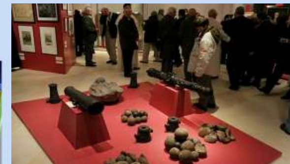
Ченстоховский Музей Аллея Пресвятой Девы Марии 45а, тел. +48 34 360 56 31, www.muzeumczestochowa.pl, e-mail: muzeum@muzeumczestochowa.pl Это почти сто лет деятельности. Один из наиболее старинных культурных институтов Ченстоховы. Существует с 1905 года. Здесь задокументировано региональное наследие, касающееся прошлого Ченстоховы и всей страны. В Музее представлено великолепное собрание польской и региональной живописи, в коллекции картины Янека Мальчевского, Войцеха Вейсса, Яна Цыбиса, Теодора Аксентовича, а также богатое и характерное для польского искусства собрание графики. В Музее собраны также богатые коллекции исторического содержания в том числе: оружие, монеты и медали; природной тематики коллекция насекомых, из области археологии специальная и уникальная экспозиция в Археологическом Заповеднике - части кладбищ а периода, называемого лужицкой культурой.