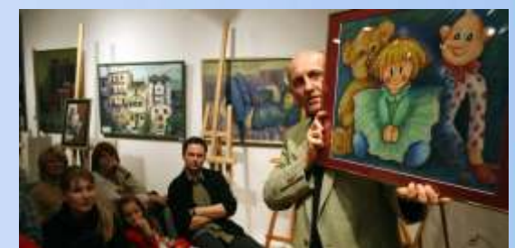
Галерея OPK GAUDE MATER (D-4) ул. Домбровского 1; тел.+48 34 324 36 38 www.gaudemater.pl, e-mail: biuro@gaudemater.pl открыто: понедельник - пятница 9.00 - 18.00 Представляет собой место презентации творцов всех художественных направлений: живописи, графики, рисунка и фотографии - посредством индивидуальных и соборных экспозиций. Галерея организует как выставки художественной среды Ченстоховы, так и избранных авторов из Польши и из-за рубежа. Является местом встречи с современным искусством и очень часто открытием новых имен и направлений, а также местом их конфронтации с признанными художниками. Интимная атмосфера Галереи способствует непосредственному восприятию искусства и прекрасно концентрирует внимание на представленных работах. Галерея организует также Международное Бьеннале Миниатюры - единственную в своем роде конфронтацию работ с максимальным форматом 10 x 10 см. Здесь также ежегодно проходит «открытие» защита дипломных работ, созданных в мастерских живописи и графики художе- ственного Отделения Высшей Педагогической Школы и выставка выпускников «Диплом». Это обзор самых ценных достижений молодых авторов, их первая встреча с общественностью посредством профессионально подготовленной экспозиции.